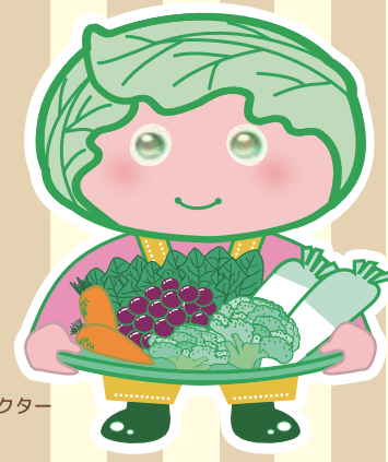
西東京市農産物キャラクター 「めぐみちゃん」