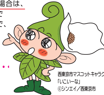
西東京市マスコットキャラクター 「いーな」

この制度は、通常学級に入学する新1年生を対象とし、西東京市教育委員会が就学予定児童・生徒の保護者へ就学校(入学する小・中学校)を通知する前に、保護者が西東京市立小・中学校の中から入学を希望する学校を事前に申し立てることができる制度です。 住所地の指定校に入学される場合は、お手続きの必要はありません。 (住所地の指定校については内面の学校一覧でご確認ください。)各学校の施設状況等により受入枠を設定していますので、この枠を超える申し立てがあった場合には、抽選となります。あらかじめご了承ください。また、施設状況等により本制度による受入れができない学校がありますので、学校一覧をご確認の上、申し立てをお願いします。