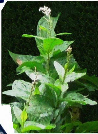
あいそ はな 藍の花